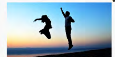
恋愛歌 A.K.A. 初恋の歌- なちよ (RENAI UTA A.K.A. HATSUKOI NO UTA - Nacho)