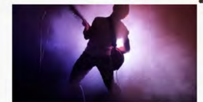
WE ARE C1's