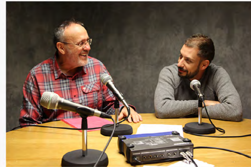
Italiani a Pamplona, un programma di interviste dedicate agli italiani che passano per la nostra città oppure ci vivono.